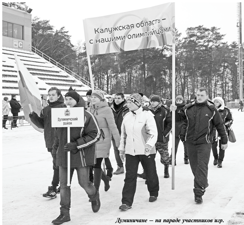
Думиничане — на параде участников игр.

шлом году, заработали очков гиревика, футболисты и механизаторы. Да, они очень старались, но соперники были сильнее.