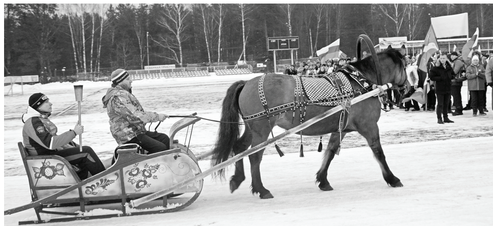
Огонь спортивных игр доставили на арену «Аппенки» на живописных санях.

Запомнилась очень красивая церемония открытия. Особенный момент и повод для гордости — участие нашей сборной в акции в поддержку российских