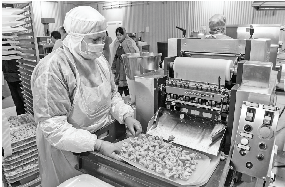
На Думиничском мясокомбинате и Думиничской производственной компании высоким гостям рассказали о своих достижениях и перспективах развития.