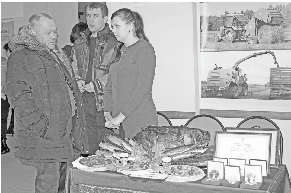
СПК «Рыбный»: деликатесы, а рядом - награды за них.