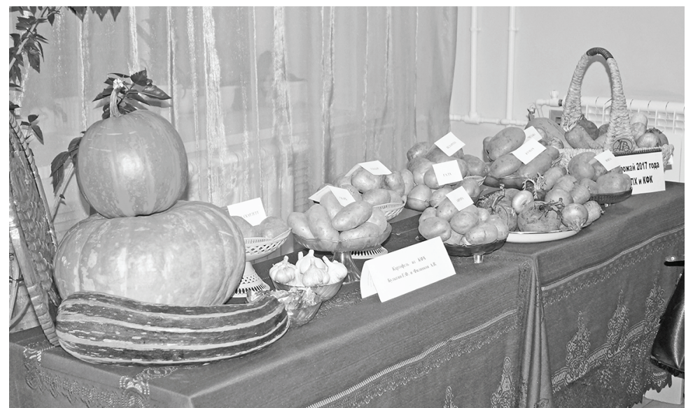
Урожай-2017, продукция КФХ и ЛПХ.